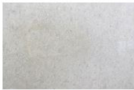
BETON LISSE BRUT