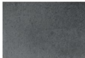
BETON LISSE ANTHRACITE