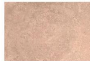
BETON LISSE BRIQUE ROUGE