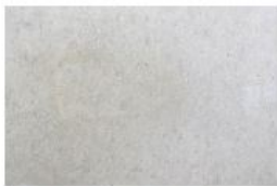
BETON LISSE BRUT