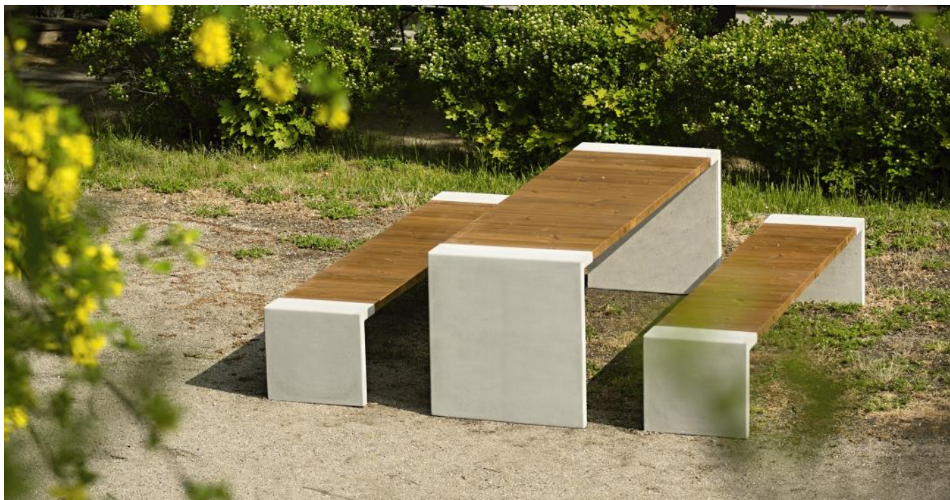
Table de pique-nique 1m80

Description : La structure est faite en béton de classe C 30/37. La table est composée de 15 planches en bois de : chêne ou Pin thermo traité avec la solution Thermowood. Les planches de bois sont assemblées à la structure par des écrous M8.