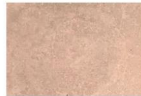
BETON LISSE BRIQUE ROUGE