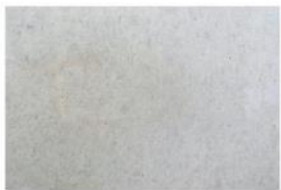
BETON LISSE BRUT