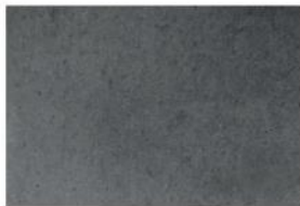
BETON LISSE ANTHRACITE